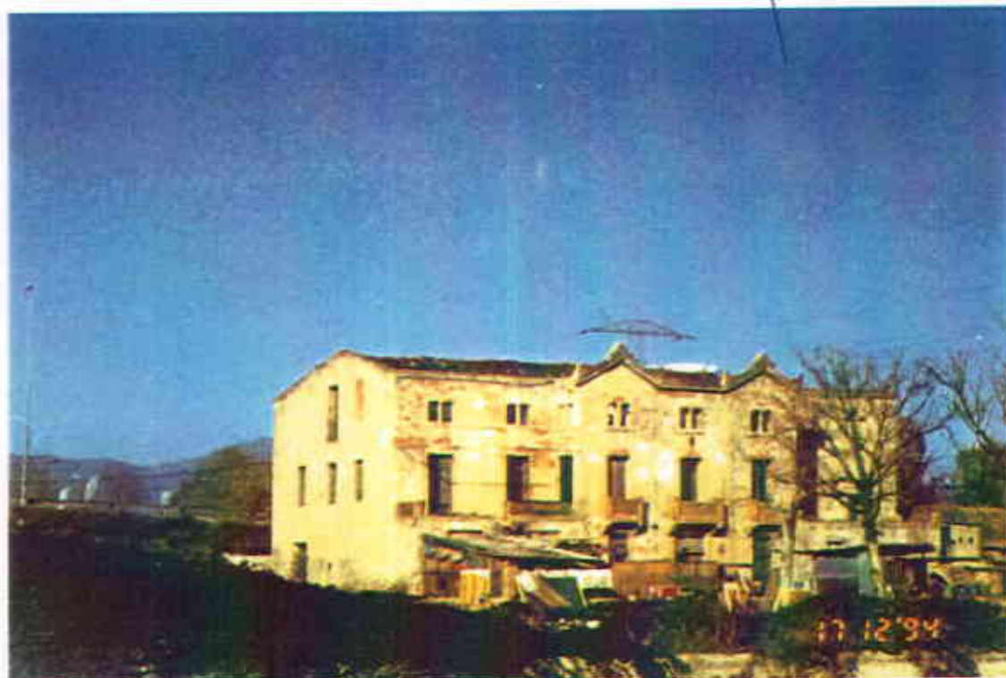
Vista general de la masia ( Desembre 1994 )